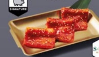
K15 ซีโรงหมูหมักซอสโคชูจังเกาหลี Korean Sauce Marinated Pork Ribs ซีโรงหมูหมักซอสโคชูจังเกาหลี 100 ฿