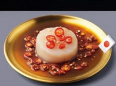
K22 โฮตาคะญี่ปุ่นคองซ็องเกาหลี Japanese Hotate with Korean Soy Sauce โฮตาคะญี่ปุ่นคองซ็องเกาหลี 199 ฿