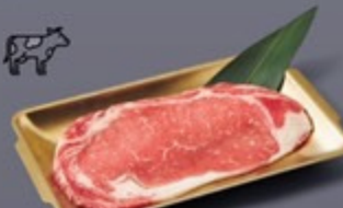
K07 เนื้อสันนอกสเต็ก Premium Striploin Steak เนื้อสันนอกสเต็ก 299 ฿