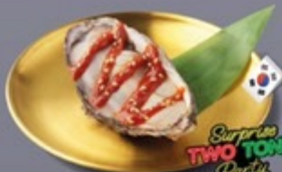
L14 หอยนางรมเกาหลีราคาซอสโคชูจัง Korean Oyster with Gochujang Sauce หอยนางรมเกาหลีราคาซอสโคชูจัง 175 ฿