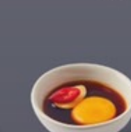
M05 โทงคังซ็องเกาหลี Pickled Egg with Korean Soy Sauce โทงคังซ็องเกาหลี 100 ฿