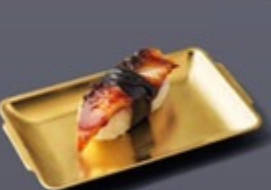
M02 ซูชิปลาไหล Unagi Sushi ซูชิปลาไหล 180 ฿