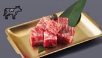
K01 เนื้อสับในลูกตาซอสทรัฟเฟิล Diced Beef with Truffle Sauce เนื้อสับในลูกตาซอสทรัฟเฟิล 199 ฿