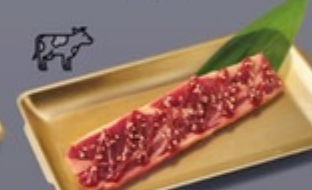
K14 ซีโรงเนื้อซอสโคชูจัง Beef Rib with Gochujang Sauce ซีโรงเนื้อซอสโคชูจัง 399 ฿