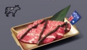
K05 เนื้อโพงาย AUS ซอสทรัฟเฟิล AUS Chuck Eye Beef with Truffle Sauce เนื้อโพงาย AUS ซอสทรัฟเฟิล 249 ฿