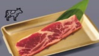
K13 ซีโรงเนื้อ Beef Rib ซีโรงเนื้อ 399 ฿