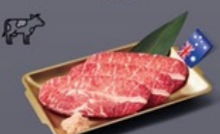
K06 เนื้อโพงาย AUS เกลือหิมาลายัน AUS Chuck Eye Beef with Himalaya Salt เนื้อโพงาย AUS เกลือหิมาลายัน 249 ฿