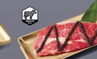
K11 เนื้อวากิว AUS ซอสทรัฟเฟิล AUS Wagyu with Truffle Sauce เนื้อวากิว AUS ซอสทรัฟเฟิล 399 ฿