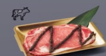
K08 เนื้อสันนอกสเต็ก ซอสทรัฟเฟิล Premium Striploin Steak with Truffle Sauce เนื้อสันนอกสเต็ก ซอสทรัฟเฟิล 299 ฿