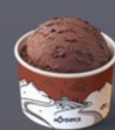
H09 โทงคัง Mövenpick Sf Swiss Chocolate Mövenpick Swiss Chocolate Ice Cream Mövenpick Swiss Chocolate 冰淇淋 100 ฿