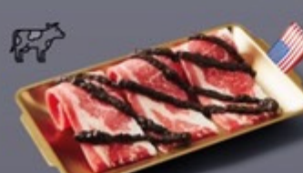
K03 เนื้อส่วนท้อง US ซอสทรัฟเฟิล US Brisket with Truffle Sauce เนื้อส่วนท้อง US ซอสทรัฟเฟิล 199 ฿