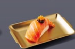
M01 ซูชิแซลมอนทรัฟเฟิล Truffle Salmon Sushi ซูชิแซลมอนทรัฟเฟิล 120 ฿