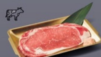
K09 เนื้อสันนอกสเต็ก เกลือหิมาลายัน Premium Striploin Steak with Himalaya Salt เนื้อสันนอกสเต็ก เกลือหิมาลายัน 299 ฿