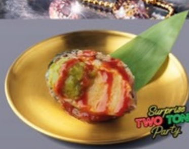
L12 เป้าชิงราคาซอสโคชูจังน้ำจิ้มซีฟู้ด Abalone with Gochujang and Seafood Sauce เป้าชิงราคาซอสโคชูจังน้ำจิ้มซีฟู้ด 199 ฿