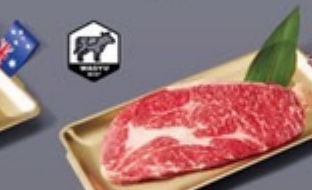
K12 เนื้อวากิว AUS เกลือหิมาลายัน AUS Wagyu with Himalaya Salt เนื้อวากิว AUS เกลือหิมาลายัน 399 ฿