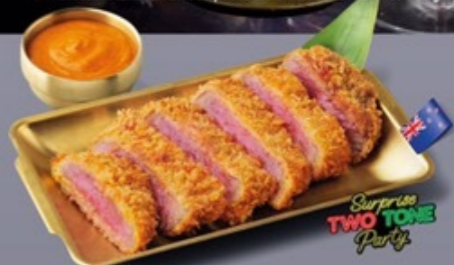
L11 เนื้อสันนอก NZ คัดสีซอสโคชูจังมายโ NZ Sirloin Katsu with Gochujang Mayo เนื้อสันนอก NZ คัดสีซอสโคชูจังมายโ 399 ฿