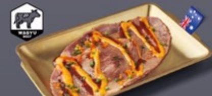
M03 ซูชิวากิว AUS ซอสโคชูจังมายโ AUS Wagyu with Gochujang Mayo Sushi ซูชิวากิว AUS ซอสโคชูจังมายโ 199 ฿