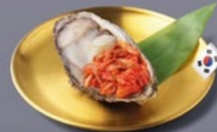
K19 หอยนางรมเกาหลีซาซิมิกับกิมจิ Korean Oyster Sashimi with Kimchi หอยนางรมเกาหลีซาซิมิกับกิมจิ 175 ฿