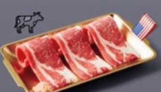
K04 เนื้อส่วนท้อง US เกลือหิมาลายัน US Brisket with Himalaya Salt เนื้อส่วนท้อง US เกลือหิมาลายัน 199 ฿