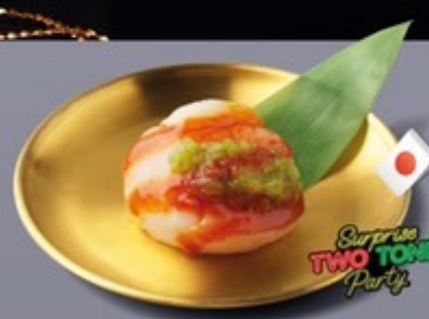
L13 โฮตาคะญี่ปุ่นราคาซอสโคชูจังน้ำจิ้มซีฟู้ด Japanese Hotate with Gochujang and Seafood Sauce โฮตาคะญี่ปุ่นราคาซอสโคชูจังน้ำจิ้มซีฟู้ด 199 ฿