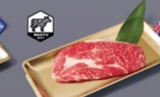
K10 เนื้อวากิว AUS AUS Wagyu เนื้อวากิว AUS 399 ฿