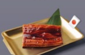
K18 ปลาไหล Unagi ปลาไหล 299 ฿