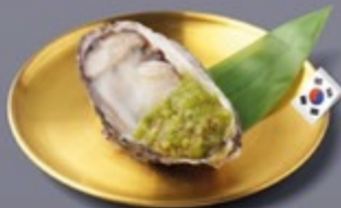
K20 หอยนางรมเกาหลีซาซิมิน้ำจิ้มซีฟู้ด Korean Oyster Sashimi with Seafood Sauce หอยนางรมเกาหลีซาซิมิน้ำจิ้มซีฟู้ด 175 ฿