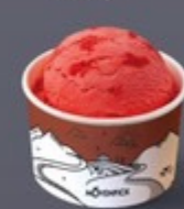
H10 โทงคัง Mövenpick Sf Raspberry & Strawberry Mövenpick Raspberry & Strawberry Ice Cream Mövenpick Raspberry & Strawberry 冰淇淋 100 ฿