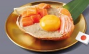
K16 มินปูญี่ปุ่นหน้าท้องปลาแซลมอนและปูอัด Japanese Crab Paste with Salmon Belly & Crab Stick มินปูญี่ปุ่นหน้าท้องปลาแซลมอนและปูอัด 459 ฿