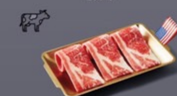
K02 เนื้อส่วนท้อง US US Brisket เนื้อส่วนท้อง US 199 ฿