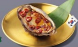
K21 หอยนางรมเกาหลีคองซ็องเกาหลี Korean Oyster with Korean Soy Sauce หอยนางรมเกาหลีคองซ็องเกาหลี 175 ฿