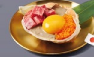
K17 มินปูญี่ปุ่นหน้าเนื้อนำเข้าและโทงคัง Japanese Crab Paste with Imported Beef & Ebiko มินปูญี่ปุ่นหน้าเนื้อนำเข้าและโทงคัง 459 ฿