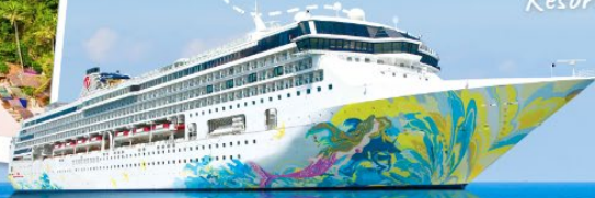
Resorts World One 名勝世界壹號