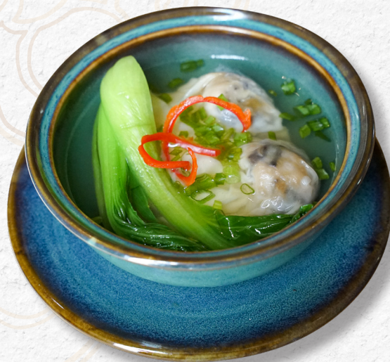
40. SÚP SỦI CẢO Dumpling soup