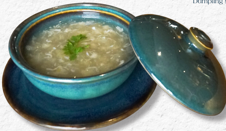
41. SÚP BÔNG BÓNG CÁ Fish maw soup