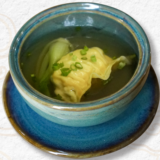
39. SÚP BÁNH XẾP HẢI SẢN Seafood dumpling soup