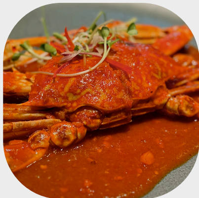
Stir-fried Flower Crab with Chilli Sauce 辣酱炒海蟹 칠리소스를 곁들인 게 볶음