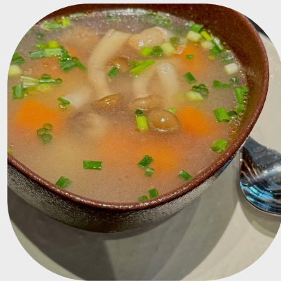
Mushroom and Vegetable Broth