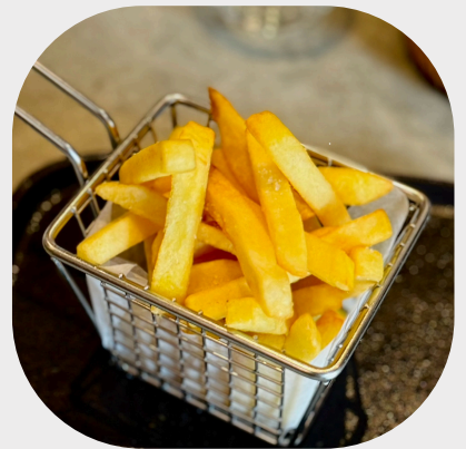
Crispy French Fries