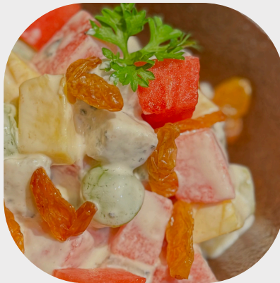
Mixed Tropical Fruit Salad 热带水果沙拉 열대 과일 견과류 샐러드