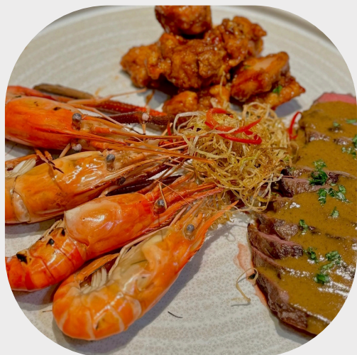
Lobster Surf & Turf 美式烤牛肉配海鲜 바베큐 해산물 & 스테이크