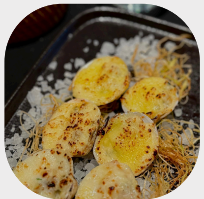
Baked Ocean Clam with Cheese Sauce 烤大洋贝壳 치즈 소스를 곁들인 구운 가리비