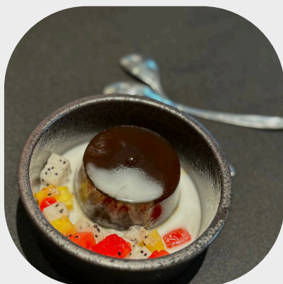
Chilled Coffee with Coconut Cream Jelly