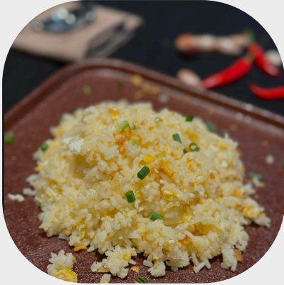
Garlic Fried Rice