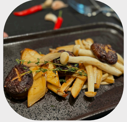
Grilled Organic Mushroom with Olive Oil