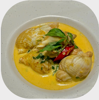
Stir-fried Bulot Snail with Coconut Milk 椰奶炒加拿大翡翠螺 코코넛 밀크 달팽이 볶음