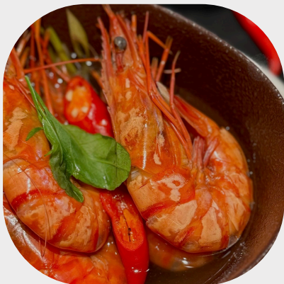
Steamed Prawn with Lemongrass 香茅草蒸对虾 레몬그라스 새우 찜