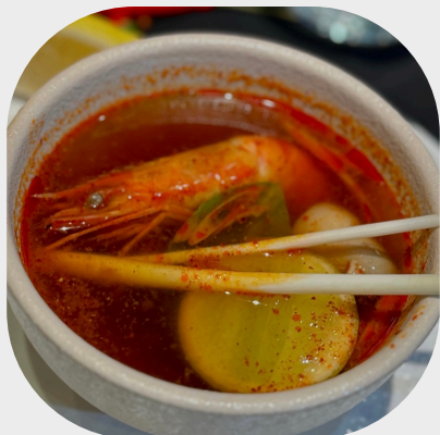
Hot and Sour Tom Yum Goong 泰式酸辣海鲜汤 태국식 매콤새콤 해산물 수프