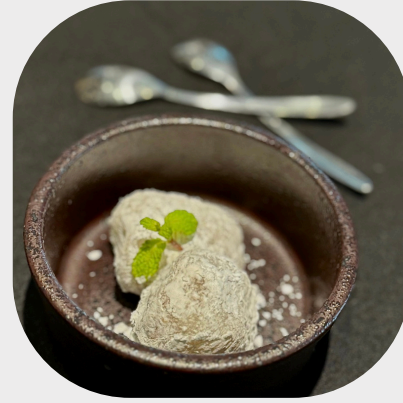
Hoi An Traditional Mango Cake