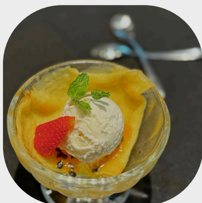
Crêpes Suzette with Coconut Ice Cream