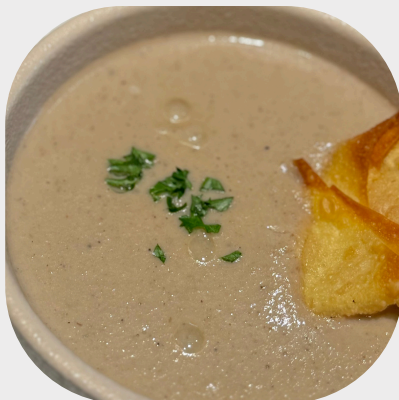
Mushroom Bisque with Seafood Wonton 海鲜馄饨饼配蘑菇浓汤 바삭한 해산물 크래커를 곁들인 버섯 크림수프