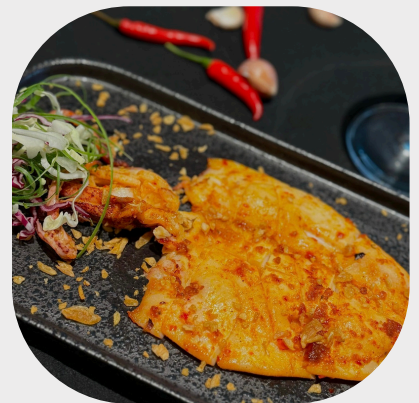
Grilled Squid with Butter Garlic 黄油蒜头烤墨鱼 마늘 버터에 구운 오징어