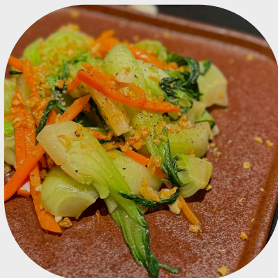
Stir-fried Vegetable with Butter Garlic