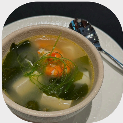
Seafood with Seaweed Broth