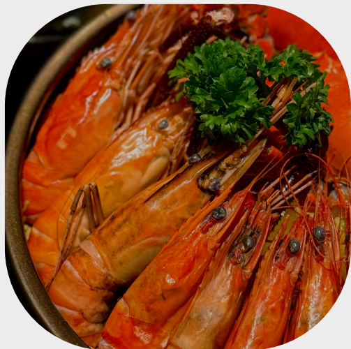
Chilled All Seasons Seafood Tower 季节性的海鲜塔 사계절 해산물 타워