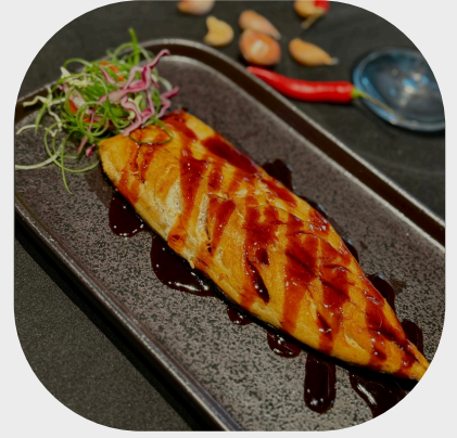
Grilled Mackerel with Sake Teriyaki Sauce 日式照烧酱烤鲭鱼 데리야키 소스 고등어구이