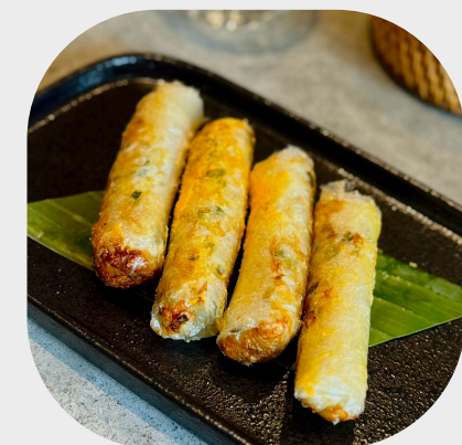
Shaked Corn Spring Rolls with Cheese 玉米春卷配干酪 치즈 소스를 곁들인 옥수수 롤