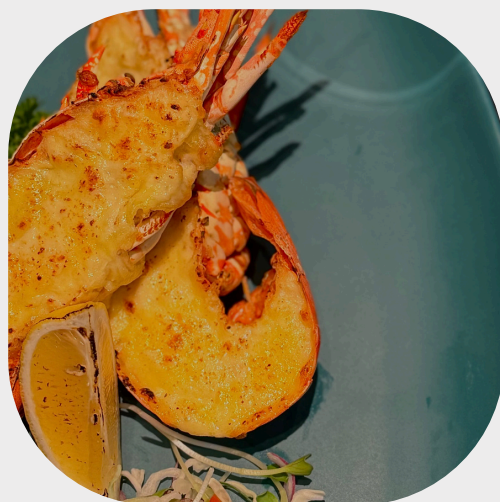
Baked Lobster with Melted Cheese & Truffle Oil 烤龙虾配松露油芝士 치즈와 트러플 오일을 넣은 구운 랍스터