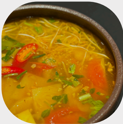
Hot and Sour Fish Broth