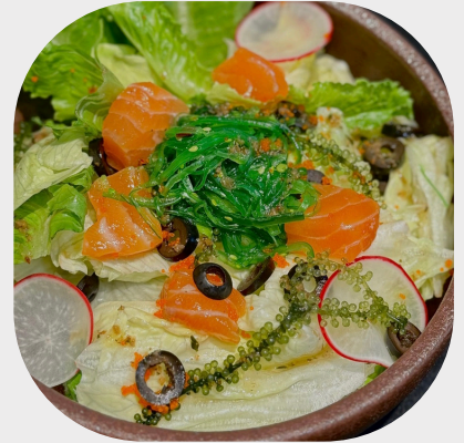
Seaweed and Salmon Salad 三文鱼海带沙拉 연어 해초 샐러드