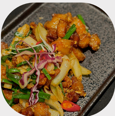
Caramelized Pork with Chilli-Garlic 辣椒蒜头炸猪头肉 마늘과 칠리로 구운 돼지고기