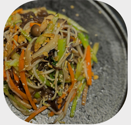
Stir-fried Vermicelli with Mushroom