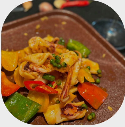
Stir-fried Squid with Green Peppercorn 青胡椒炒墨鱼 피망을 곁들인 오징어볶음