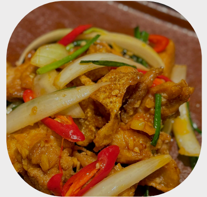
Caramelized Chicken Drumstick with Fish Sauce 鱼露煎鸡腿 피시 소스 치킨 볶음