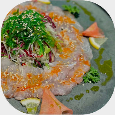
Chilled Red Snapper Carpaccio 啮鱼生鱼片凉拌 참돔 카르파초 샐러드