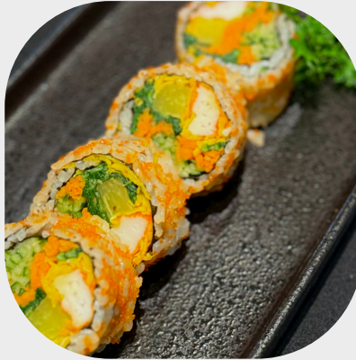
Futomaki with Ebiko 覆蛇子海鲜寿司卷 새우알 해산물 롤