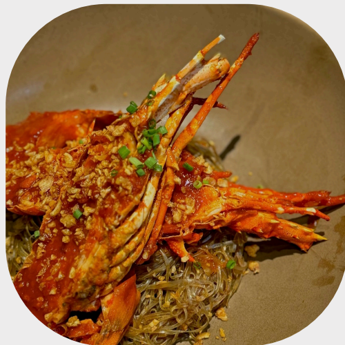
Wok-fried Lobster with Hoi An Chilli Sauce 会安辣椒酱龙虾 호이안 칠리 소스를 곁들인 랍스터 볶음