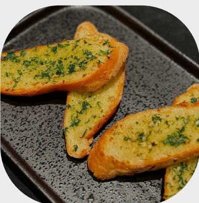
Baked Butter Garlic Bread 黄油蒜头烤面包 구운 버터 갈릭 브레드