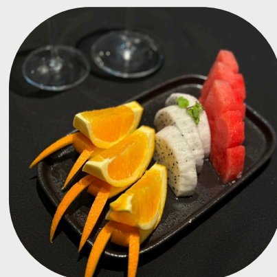
Seasonal Fresh Fruit Platter