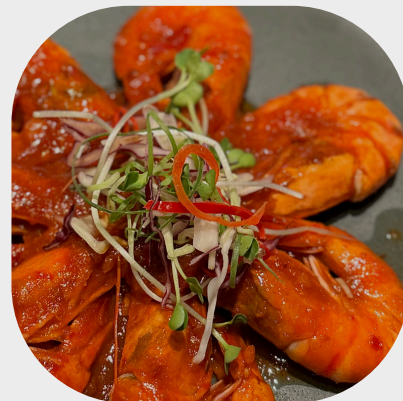
Stir-fried Prawn with Chilli Sauce 辣酱炒对虾 새우 칠리소스 볶음