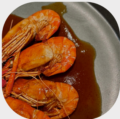
Stir-fried Langoustine with Thai's Sauce 泰式酱河虾 태국식 소스를 곁들인 가재 볶음