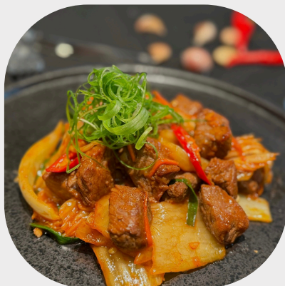
Wok-fried Beef with Pickled Cabbage 韩国泡菜炒牛肉 김치 소고기 볶음