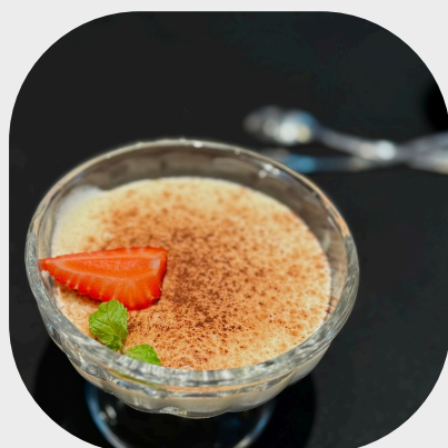
Home-made Highland Tiramisu Creme