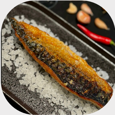
Grilled Mackerel with Rock Salt 盐烤鲭鱼 고등어 암염 소금구이