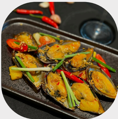
Stir-fried Mussel with Thai's Sauce 酸辣酱青贻贝 태국식 홍합 볶음