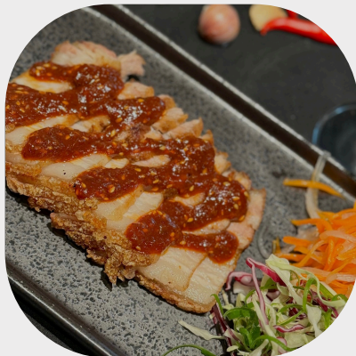
Deep-fried Crispy Pork Belly 脆炸五花肉 바삭하게 튀긴 삼겹살