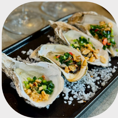
Grilled Ocean Clam with Spring Onion Salsa 香葱烤牡蛎 파 소스 굴 구이