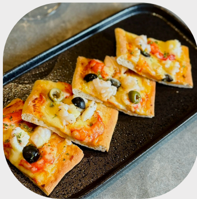
"Fruit de Mer" Pizza