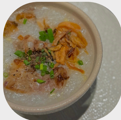
Clam & Pork Spare Rib Congee 排骨配蛤蜊粥 전복 & 돼지갈비 죽