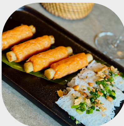
Rolled Shrimp Paste on Sugar Cane with Vermicelli 越南问饼烤甘蔗虾 베트남 당면 & 사탕수수를 곁들인 새우 롤