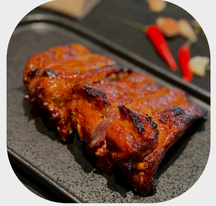
Char-grilled BBQ Pork Spare Rib B B Q 烤排骨 숯불 바비큐 돼지갈비구이