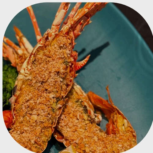
Grilled Lobster with Finest Ly Son Garlic & Butter 李山蒜头黄油烤龙虾 최고급 리손 갈릭과 버터로 맛을 낸 랍스터 구이