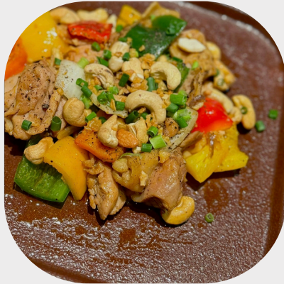
Stir-fried Chicken with Cashew Nut 腰果炒鸡肉 캐슈넛을 곁들인 치킨 볶음