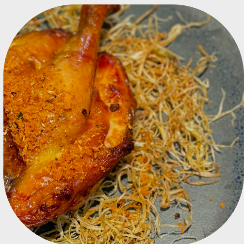
Regional Herbal Chicken Flambé 广南特产烤鸡 로컬 허브 치킨 플람베