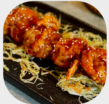
Spicy & Crispy Chicken Thighs 辣脆皮鸡腿 바삭하고 매콤한 닭 다리 살