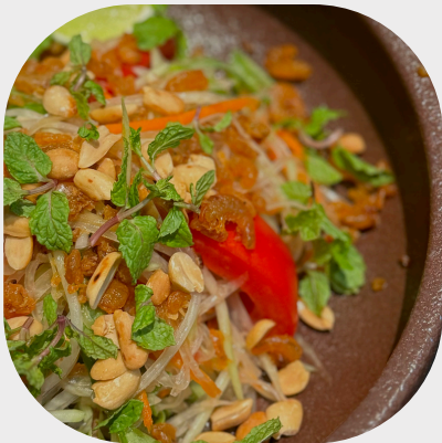
Hot and Sour Som Tum Salad 泰式辣虾子青木瓜凉拌 매콤한 태국식 파파야 새우 샐러드