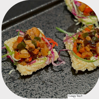
Crispy Sticky Rice with Seafood Sauce