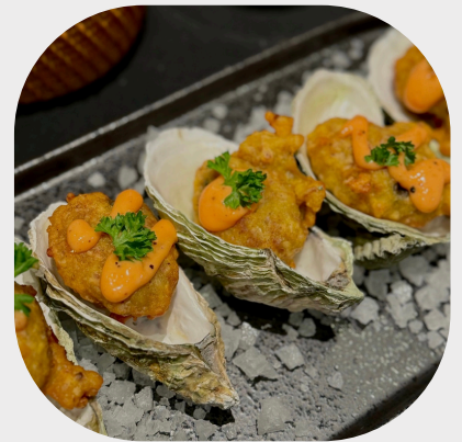
Deep-fried Crispy Oyster with Taro 脆油炸牡蛎 바삭한 굴 튀김