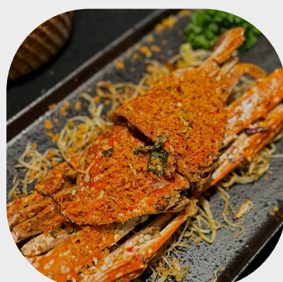
Salt-roasted Flower Crab 盐油炸海蟹 게 소금구이