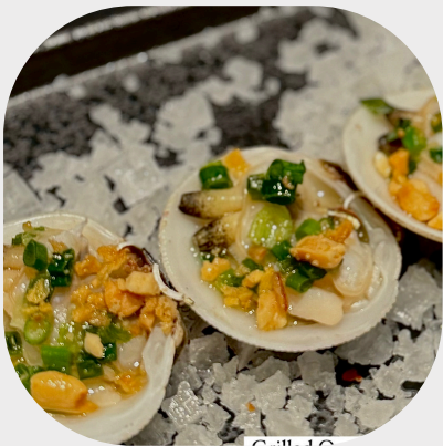
Grilled Sea Shell with Spring Onion Salsa 香葱烤大洋贝壳 파 소스 양념 조개구이