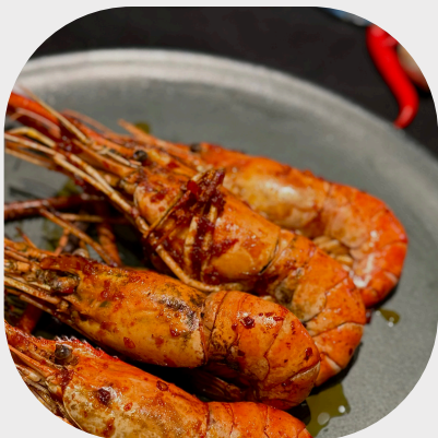
Grilled Langoustine with Chilli Sauce 盐辣椒烤河虾 칠리소스를 곁들인 가재 구이