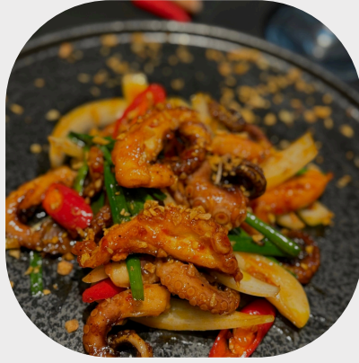
Caramelized Octopus with Garlic 蒜头炒章鱼 마늘을 곁들인 문어볶음