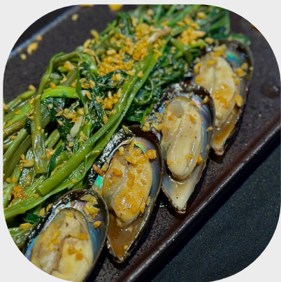
Stir-fried Mussel with Morning Glory 空心菜炒青贻贝 모닝글로리를 곁들인 홍합 볶음