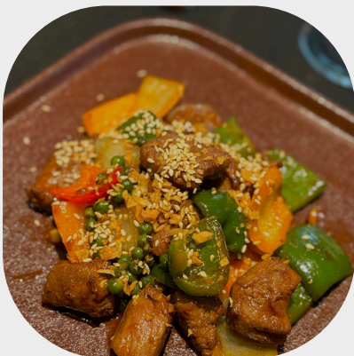
Grilled Beef with Green Peppercorn 青胡椒烤牛肉 피망을 곁들인 소고기 구이