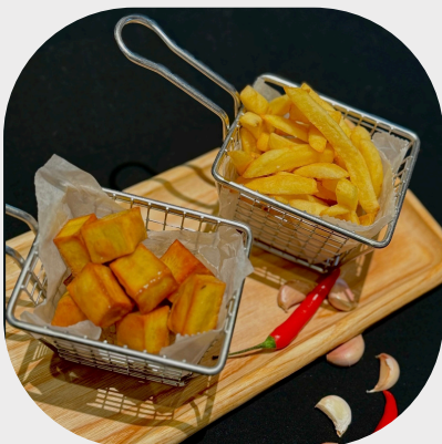
Crispy Sweet Potato with Corn Syrup