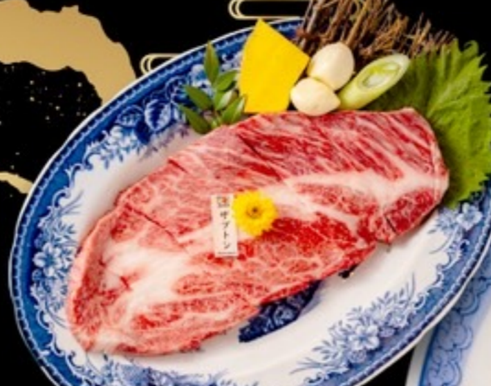
E06 Imperial Wagyu A4 Zabuton Steak เนื้อชาบูเนื้อวากิวญี่ปุ่นเสกที่ 299.- 100 กรัม / 1 แผ่น