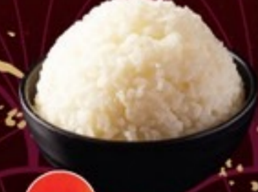
A20 Japanese Rice ข้าวญี่ปุ่น 39.- 100 กรัม / 1 ที่