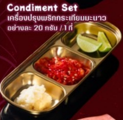
Condiment Set เครื่องปรุงรสพร้อมกะเทียมมะนาว อย่างละ 20 กรัม / 1 ที่