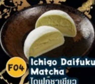
F04 Ichigo Daifuku Matcha โตฟูกุชาเขียว