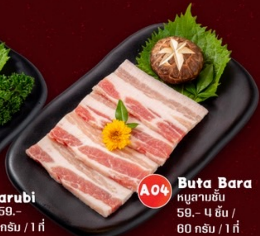
A04 Buta Bara หมูสามชั้น 59.- 4 ชิ้น / 60 กรัม / 1 ที่