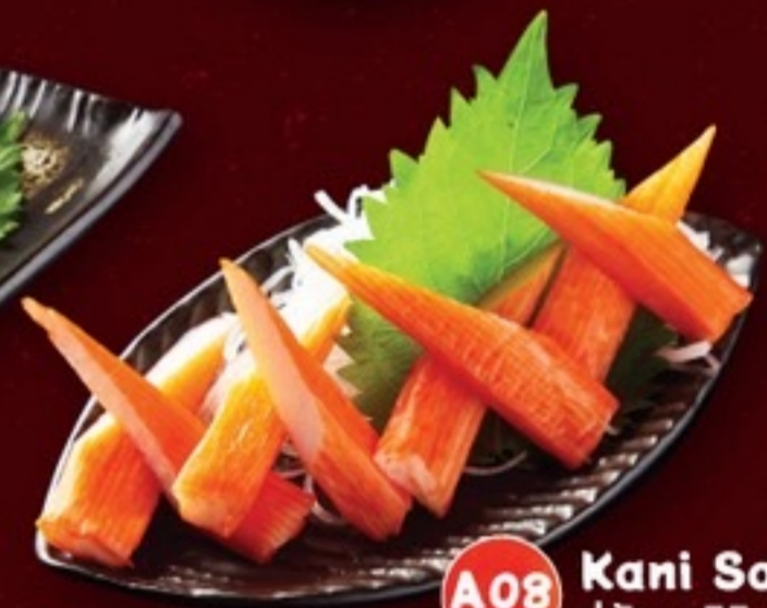
A08 Kani Sashimi ปูอัดซาซิมิ 69.- 2 แท่ง / ตัดครึ่ง