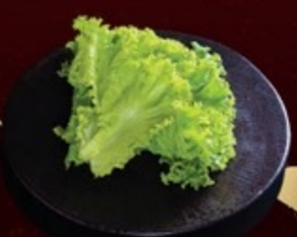
A24 Lettuce ผักกาดหอม 29.- 20 กรัม / 3 ใบ