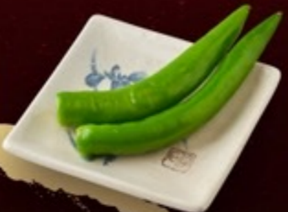
A25 Pepper พริกเขียว 29.- 2 ชิ้น / 20 กรัม / 1 ที่