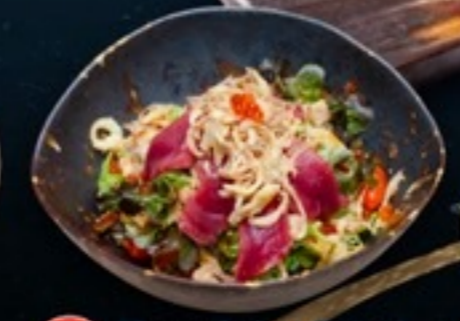
C33 Tuna Spicy Salad สลัดทูน่าสไปซี่ 149.- 25 g.