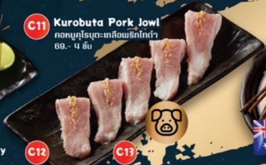
C11 Kurobuta Pork Jowl Neta Sauce คอหมูคุโรบุดะซอสเนตา 69.- 4 ชิ้น