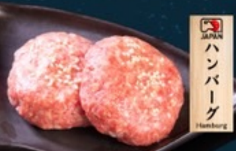
C08 Hamburg Japanese Wagyu แฮมเบอร์เกอร์วากิวญี่ปุ่น 99.- 2 ชิ้น 60 g.