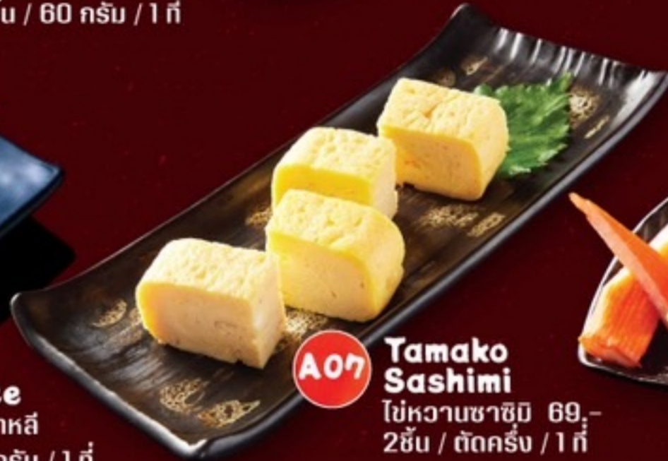
A07 Tamako Sashimi ไข่หวานซาซิมิ 69.- 2 ชิ้น / ตัดครึ่ง / 1 ที่