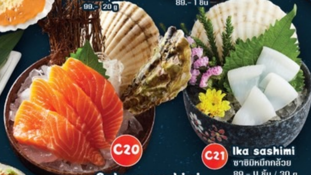
C20 Salmon sashimi ซาซิมิแซลมอน 229.- 4 ชิ้น