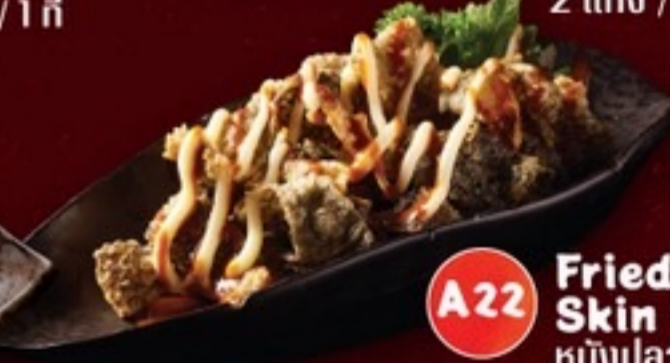
A22 Fried Salmon Skin หนังปลาแซลมอนทอด 59.- 50 กรัม / 1 ที่