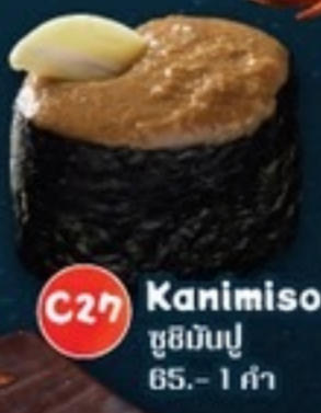
C27 Kanimiso Sushi ซูชิมันปู 65.- 1 คำ