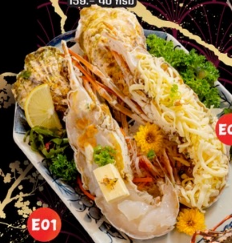
E01 Thai lobster Butter กุ้งมังกรย่างเนย 499/Half