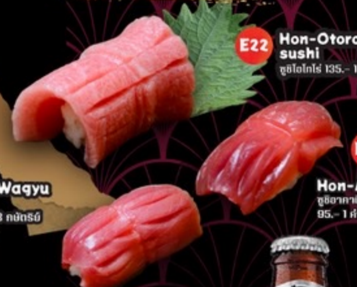
E22 Non-Otoro sushi ซูชิโตโตโร่ 135.- 1 ตัว