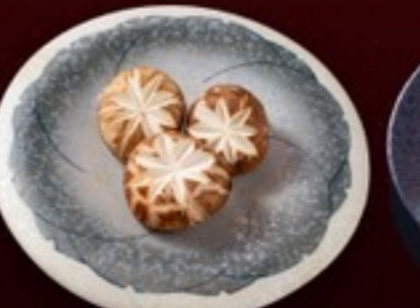
A27 Oringqi เห็ดหอม 19.- 3 ชิ้น / 30 กรัม / 1 ที่