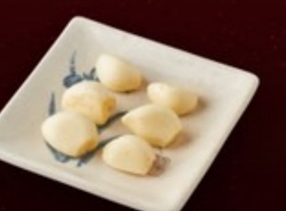
A30 Garlic กระเทียม 19.- 5 ชิ้น / 1 ที่