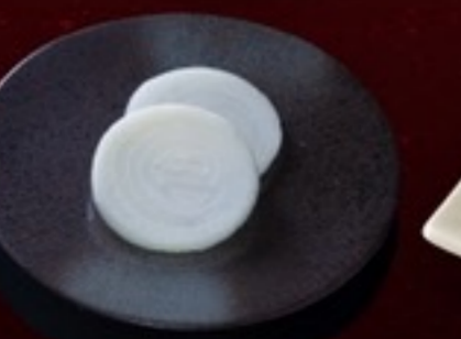
A29 Onion หอมหัวใหญ่ 19.- 2 ชิ้น / 40 กรัม / 1 ที่