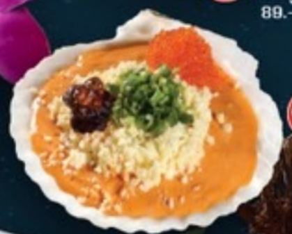
C02 Ebi Miso Cheese มันกุ้งเม้บ๊วย 89.- 40 g