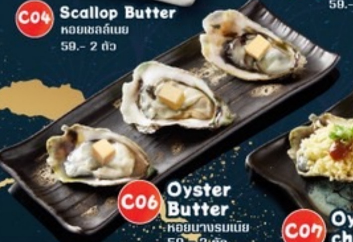
C06 Oyster Butter หอยนางรมเนย 59.- 2 ตัว