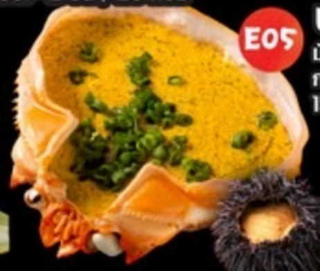
E05 Uni Miso มันไข่หอยเม่นใน กระดองปู 159.- 40 กรัม