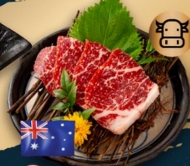
C17 Australian Wagyu Rosu เนื้อวากิวสันคอกออสเตรเลีย รสชาต 99.- 4 ชิ้น