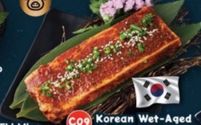
C09 Korean Wet-Aged Pork Belly หมูสามชั้นลวกเกาหลี 89.- 1 ชิ้น