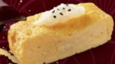
A10 Tamako Sushi ซูชิไข่หวาน 25.-