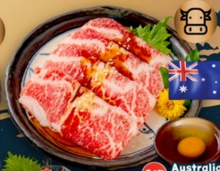
C15 Australian Wagyu Suki-yaki เนื้อวากิวซอสสุกี้ 129.- 4 ชิ้น