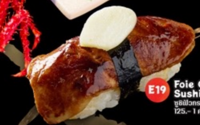
E19 Foie Gras Sushi ซูชิฟัวกราส์ 125.- 1 ตัว / 10 กรัม