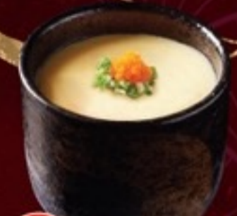
A18 Chawanmushi ไข่ตุ๋นญี่ปุ่น 39.- 150 cc / 1 ที่