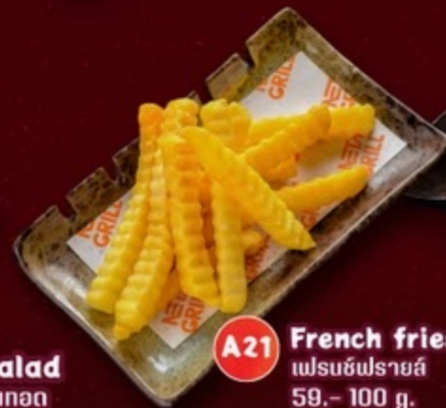
A21 French fries เฟรนช์ฟรายส์ 59.- 100 g.