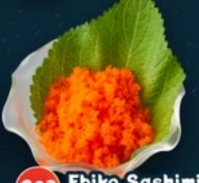
C23 Ebiko Sashimi ซาซิมิไข่กุ้งดิบ 59.- 30 g.