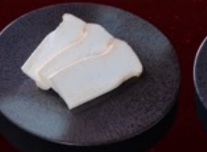
A28 Shitake เห็ดออริจินิ 19.- 3 ชิ้น / 30 กรัม / 1 ที่