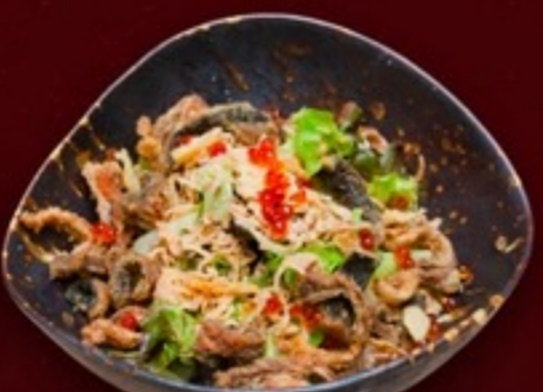
A15 Salmon Skin salad สลัดหนังปลาแซลมอนทอด 79.- 40 g.