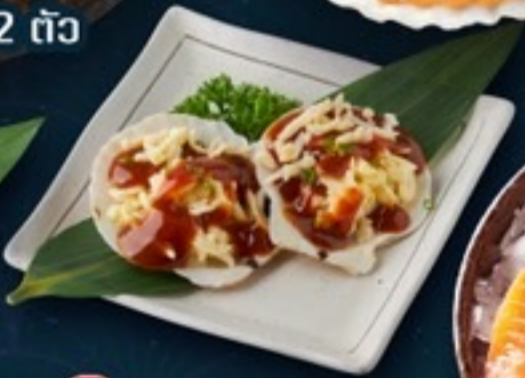
C05 Scallop Cheese หอยเชลล์ชีส 59.- 2 ตัว