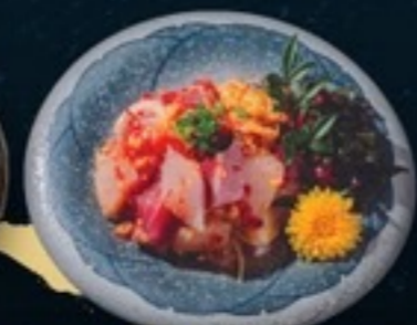
A31 Kaizen Tataki ย่างปลาแซลมอนทาคิ 169.- 30 g.