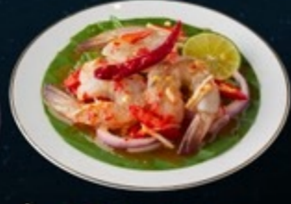
A32 Fresh Sea Prawn Zaab กุ้งสด 149.- 4 ตัว