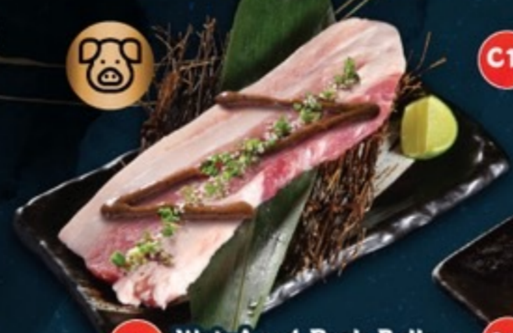
C10 Wet-Aged Pork Belly with Black Pepper หมูสามชั้นลวกซอสพริกไทยดำ 89.- 1 ชิ้น