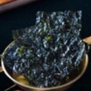
C38 Nori สาหร่ายเกาหลี 29.- 1 ซอง