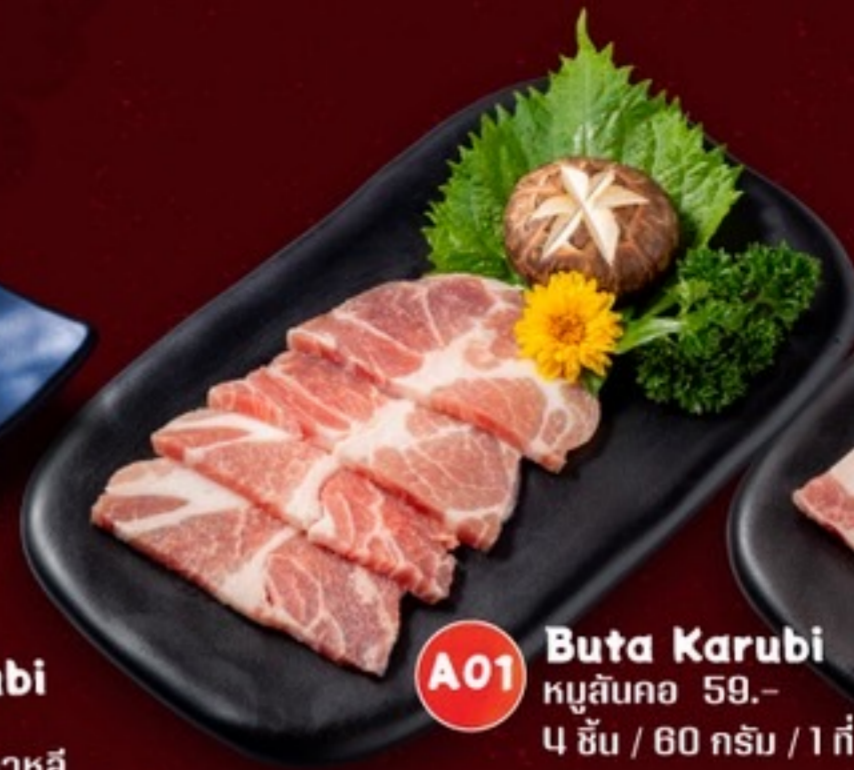
A01 Buta Karubi หมูสันคอ 59.- 4 ชิ้น / 60 กรัม / 1 ที่