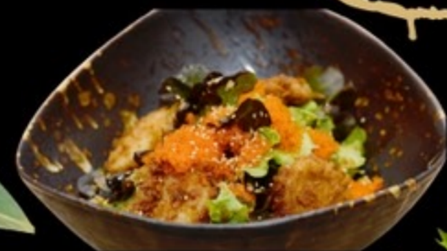
E28 Hokkaido Scallop Dynamite Salad สลัดปลาหมึกทะเลสดจากโทโฮกุ ซุนเดอญี่ปุ่นทอด 159.- 50 กรัม