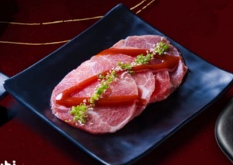
A03 Buta Karubi Korea หมูสันคอซอสเกาหลี 59.- 4 ชิ้น / 60 กรัม / 1 ที่