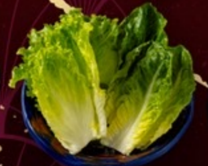
A23 Cos ผักกาด 29.- 20 กรัม / 3 ใบ