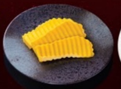
A26 Pumpkin ฟักทอง 19.- 3 ชิ้น / 30 กรัม / 1 ที่