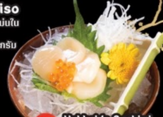
E17 Hokkaido Sashimi หอยทะเลสดจากโทโฮกุ 160 199.- 2 ชิ้น/20 กรัม