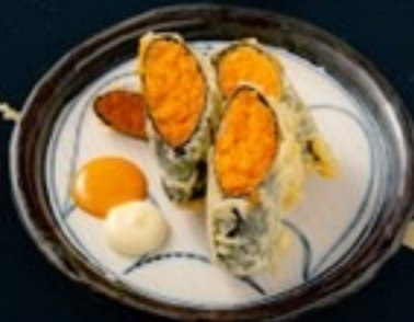
C36 Spicy Salmon Nori สไปซี่แซลมอนโนริ 59.- 2 ชิ้น