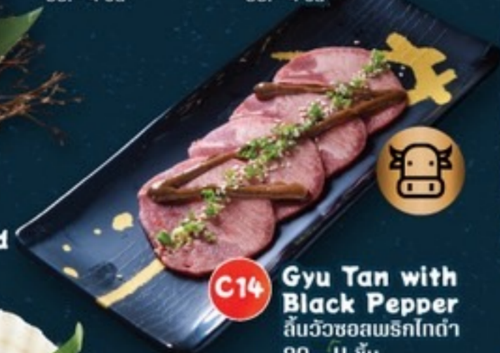
C14 Gyu Tan with Black Pepper สันวัวซอสพริกไทยดำ 89.- 4 ชิ้น