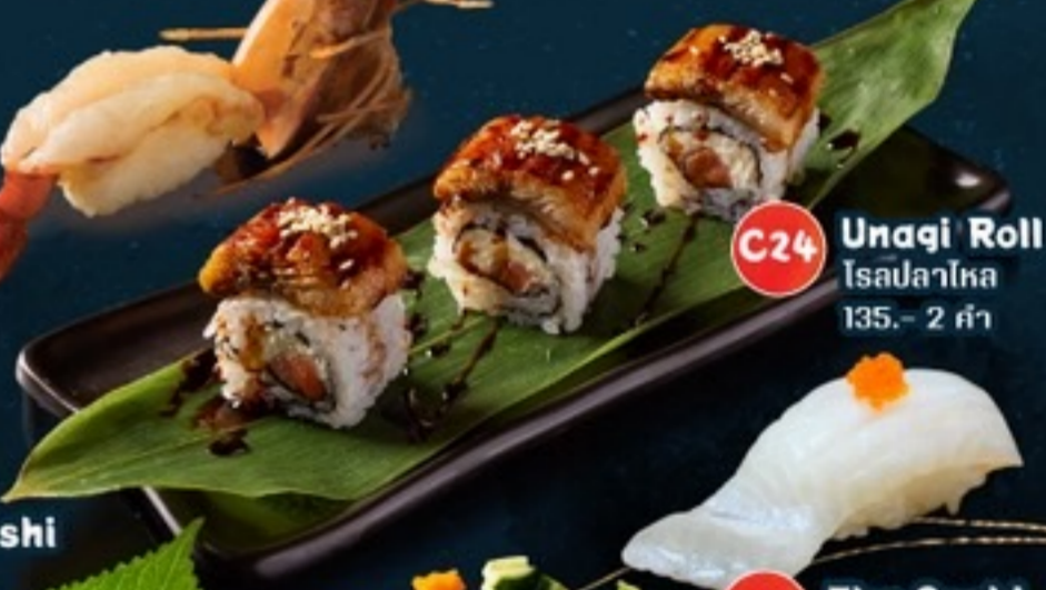
C24 Unagi Roll โรลปลาไหล 135.- 2 คำ