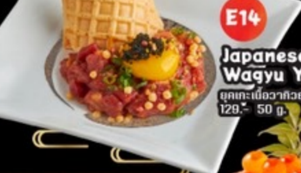
E14 Japanese Wagyu Yukke มุกทะเลเนื้อวากิวญี่ปุ่น 129.- 50 กรัม