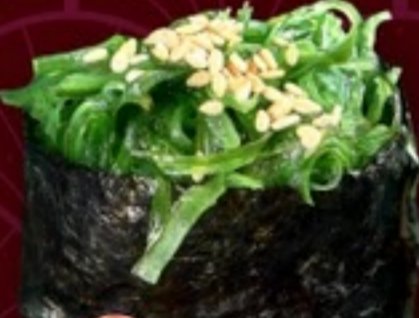
A12 Wakame Sushi ซูชิยี่สาหร่าย 25.-