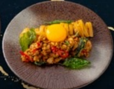
C34 Fettuccine Kapa Wagyu พาสต้าคาโบนาราวากิว 159.- 80 g.