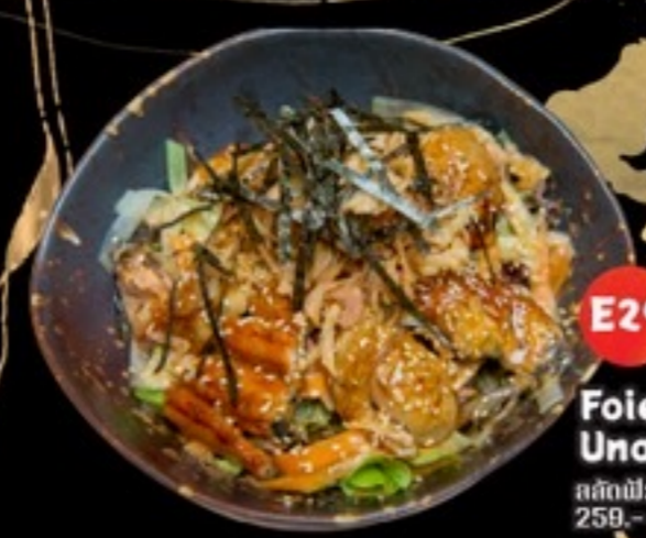
E29 Foie Gras/Unagi Salad สลัดฟัวกราส์/ปลาไหล 259.- 50 กรัม