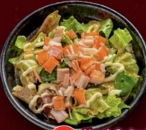
A14 Kani Salad สลัดปูอัด 79.- 40 g.