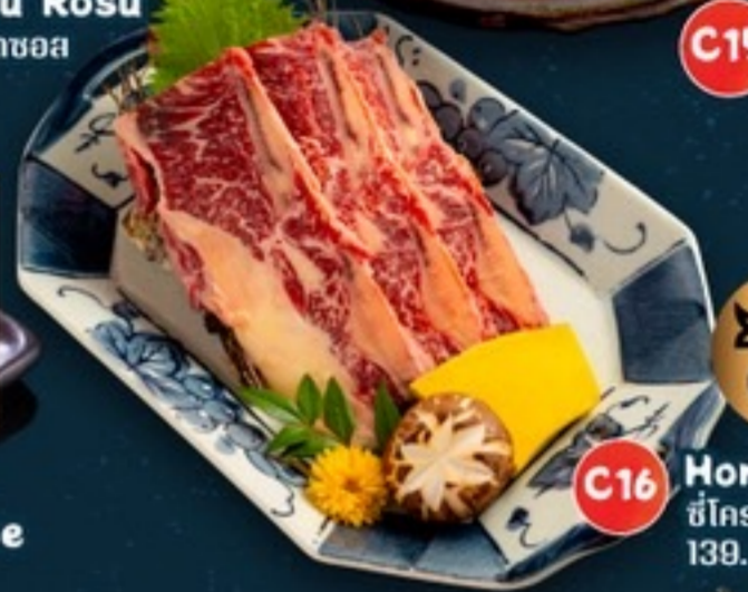
C16 Honetsuki Kalbi ซี่โครงเนื้อหมักเกาหลี 139.- 4 ชิ้น