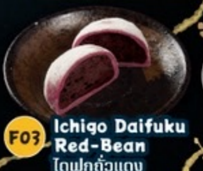
F03 Ichigo Daifuku Red-Bean โตฟูกุถั่วแดง