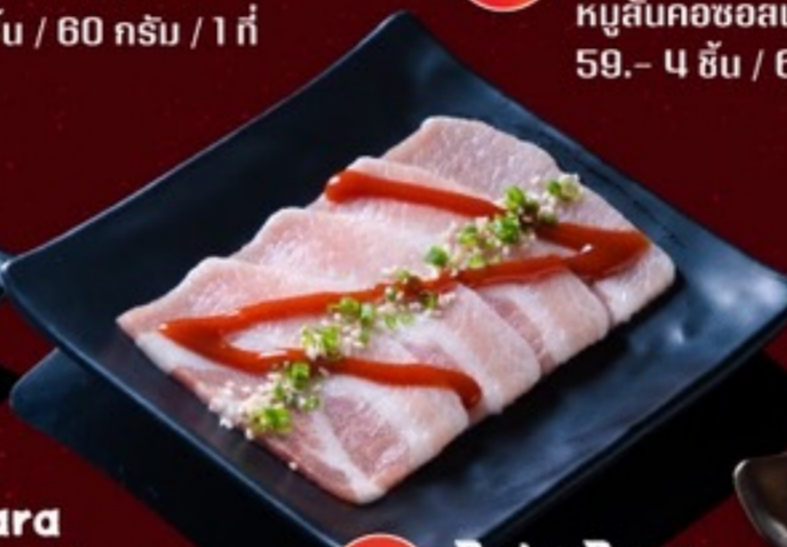
A06 Buta Bara Korea Sauce หมูสามชั้นซอสเกาหลี 59.- 4 ชิ้น / 60 กรัม / 1 ที่