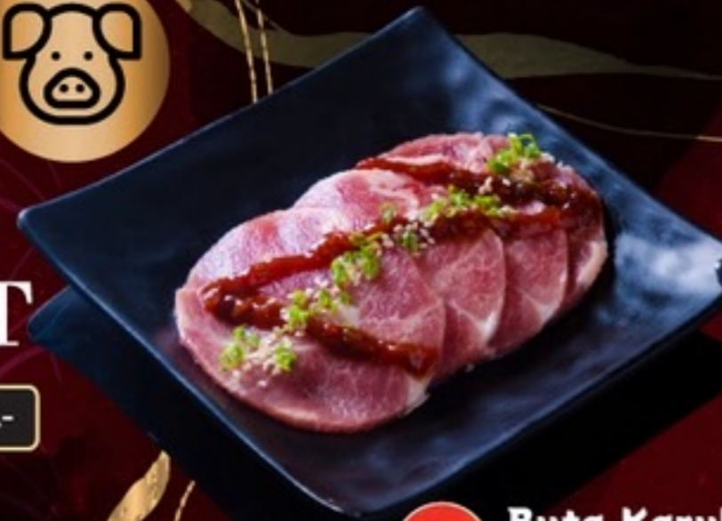
A02 Buta Karubi Neta Sauce หมูสันคอหมักซอสเนตา 59.- 4 ชิ้น / 60 กรัม / 1 ที่