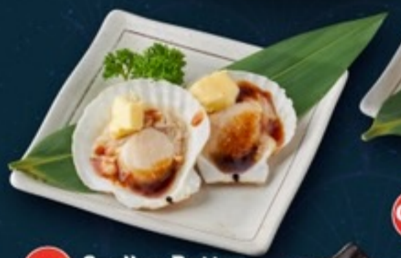
C04 Scallop Butter หอยเชลล์เนย 59.- 2 ตัว