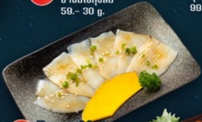
C19 Ika sashimi with sauce ปลาหมึกซาซิมิราดซอส 89.- 4 ชิ้น