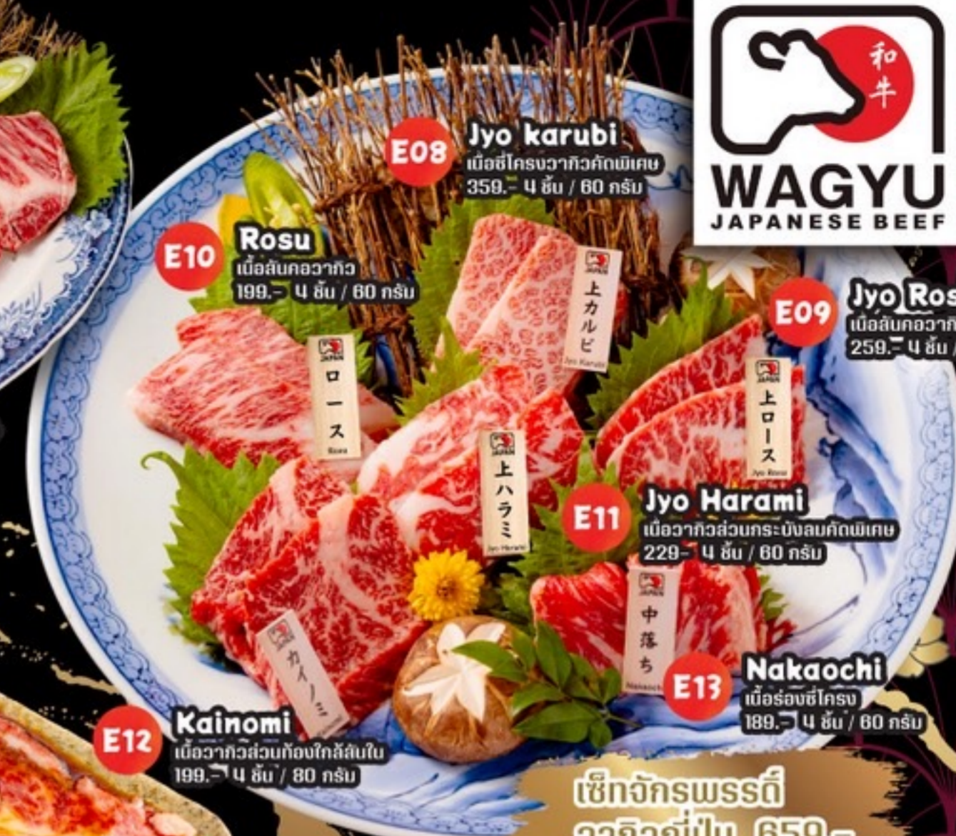
E08 Jyo Karubi เนื้อซี่โครงวากิวคัดพิเศษ 359.- 4 ชิ้น / 60 กรัม