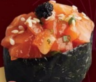
A09 Negi Spicy Salmon ซูชิแซลมอนสับสไปซี่ 35.-