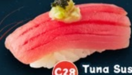
C28 Tuna Sushi ซูชิทูน่า 35.- 1 คำ