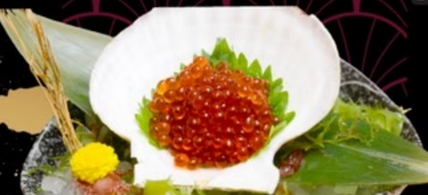
E18 Ikura Sashimi ไข่ปลาเซลมอนซาซิมิ 159.- 40 กรัม