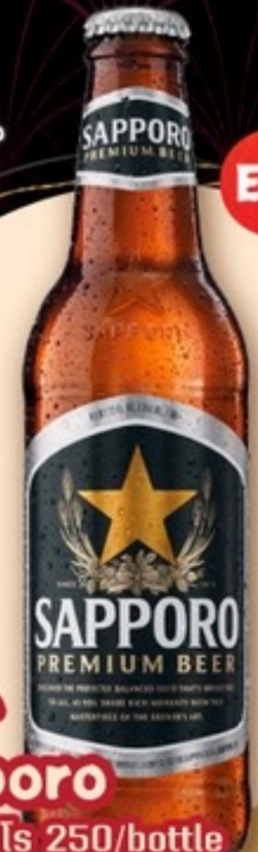
Beer Sapporo เบียร์ซัปโปโร 250/bottle