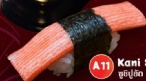
A11 Kani Sushi ซูชิปูอัด 25.-