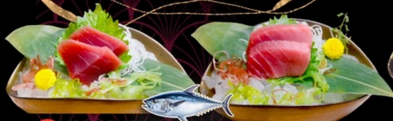
E15 Akami Sashimi อาคามิซาซิมิ 229.- 2 ชิ้น / 20 กรัม