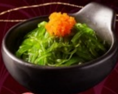
A16 Chuka Wakame ยี่สาหร่ายญี่ปุ่น 49.- 50 กรัม / 1 ที่