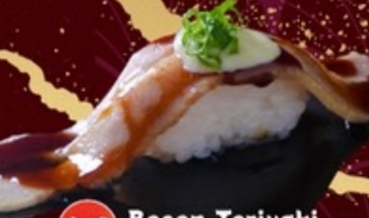
A13 Becon Teriyaki Sushi ซูชิเบคอนเทอริยากิ 25.-