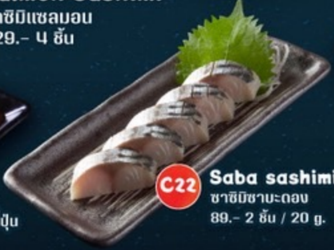
C22 Saba sashimi ซาซิมิซาบะดอง 89.- 2 ชิ้น / 20 g.