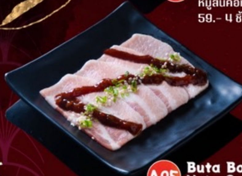
A05 Buta Bara Neta Sauce หมูสามชั้นซอสเนตา 59.- 4 ชิ้น / 60 กรัม / 1 ที่