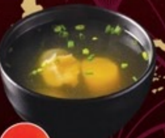
A19 Collagen Soup ซุปลีสาหร่าย 29.- 150 cc / 1 ที่