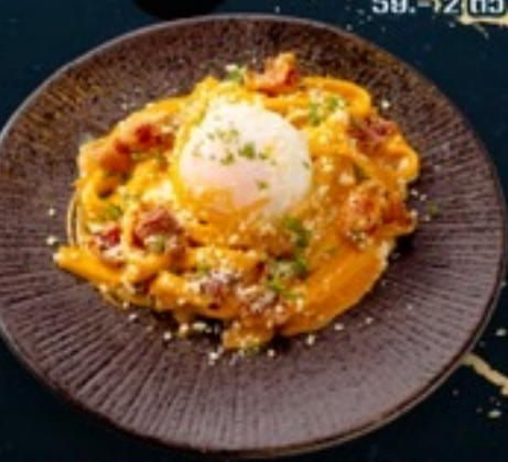
C35 Fettuccine Cabonara Sriracha พาสต้าคาโบนาราศรีราชา 189.- 80 g.