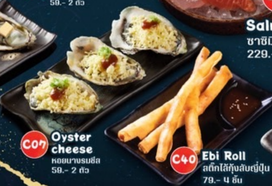
C07 Oyster cheese หอยนางรมชีส 59.- 2 ตัว