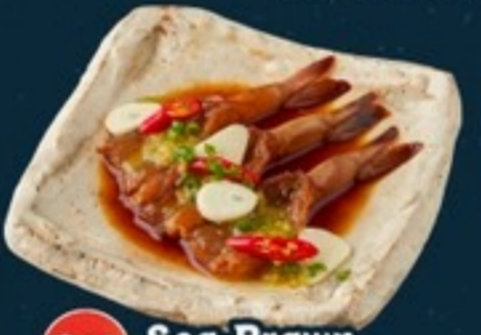
C18 Sea Prawn Marinated Zaab กุ้งดองซีอิ๊วเกาหลี 99.- 3 ตัว