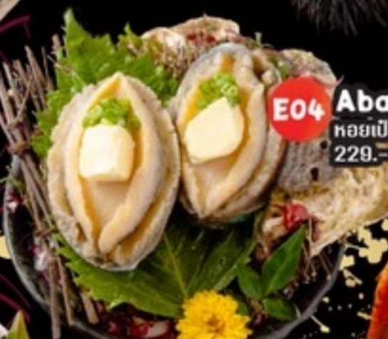
E04 Abalone หอยเป๋าฮื้อ 229.- 2 ตัว